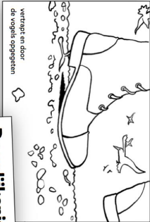
vertrapt en door de vogels opgegeten